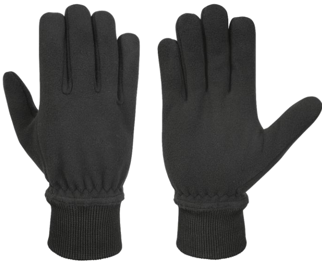
PARKER POLICE Short Black

Spezialhandschuhe für Polizei und Sicherheitskräfte.